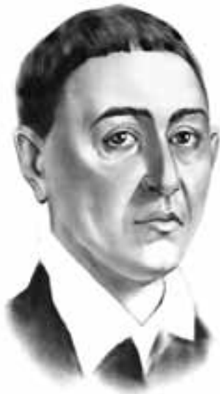
■ Григорій Савич Сковорода (1722–1794) — український просвітитель-гуманіст, філософ, поет, педагог