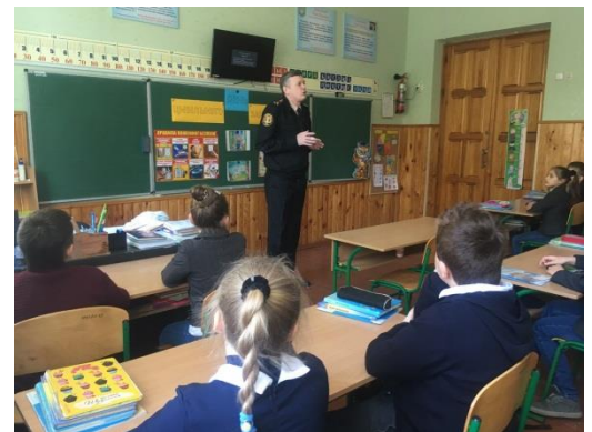
Творчий колектив учнів 9-А класу ХЗОШ № 36

Проведення Дня цивільного захисту в школі є необхідним та корисним заходом. Зрозуміло, що зовсім уникнути небезпеки, на жаль, не можна, але зменшити негативні наслідки цілком можливо. І провідна роль у цій справі належить закладам освіти, педагоги яких здатні грамотно, системно і цікаво підготувати молодь, навчити учнів захищати себе в життєво небезпечних випадках.